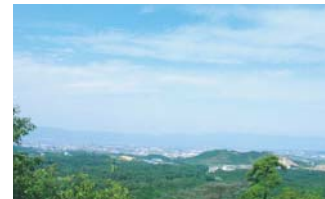
標高280mの頂上からは琵琶湖南湖が一望できます。