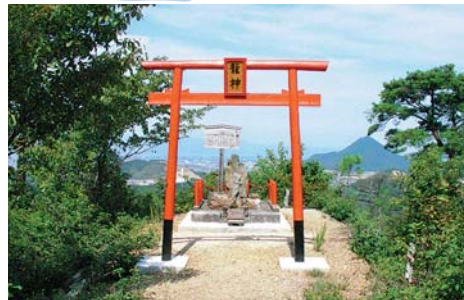
頂上付近の「龍神の鳥居」

■住所／湖南省雨山2-1-1 ■お問い合わせ／0748-77-5400(雨山文化運動公園) ■公共交通機関／JR草津線「石部駅」より車で約10分