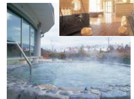
単純弱放射能低温泉。さらに優しく、疲れを癒すのにもってこい。

眺望をたっぷり楽しんだら南へ下山。木の根や岩をまたぎながら30分ほど降りてゆくと、十二坊温泉「ゆらら」に辿り着きます。広々としたロビーで受付を済ませ、さっそくお風呂へ。大門坊(大浴槽)、宝乗坊(滝風呂)など、浴槽ごとに付けられた坊名が興味をそそります。十二坊の森を見渡せるという露天風呂にざぶり。毎分400リットルも湧き出る豊富なお湯は、神経痛や筋肉痛に効果あり。湯の温もりと山間の爽やかな風、そしてスタッフの暖かい対応が、山歩き疲れをじんわり癒してくれます。