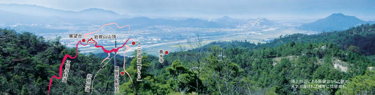
頂上付近にある展望台からの眺め。天気良ければ視界に琵琶湖も。