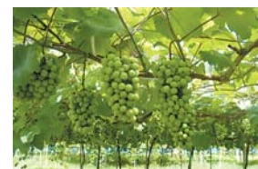
デラウェア、マスカットなどが食べ放題。

湖南を訪れる時期が8月、9月なら、温泉から車やバスで程近い大谷観光ぶどう園で、味覚狩りも楽しめます。たわわに実った果実を一ふさごとにはさみで切り離し、山の地下水でほどよく冷やしてから口へ。青空の下、自分で摘んだぶどうの味は、湖南の旅に、甘くみずみずしい思い出を付け加えてくれることでしょう。