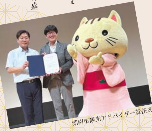
湖南省観光アドバイザー就任式