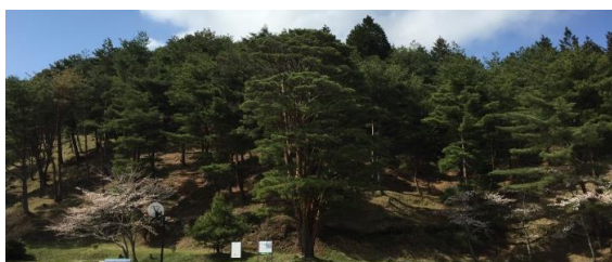
国指定天然記念物 うつくし松